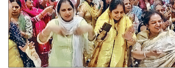
रेवाड़ी। कीर्तन में भजनों पर नाचती महिलाएं।