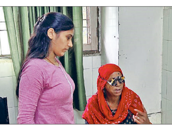
रेवाड़ी। अस्पताल में महिला की आंखों की जांच करती हुई नैत्र सहायक।