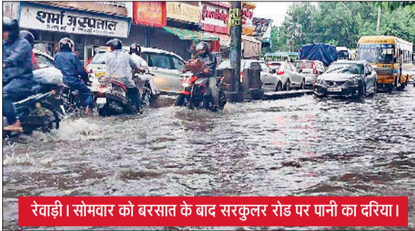
रेवाड़ी। सोमवार को बरसात के बाद सरकुलर रोड पर पानी का दरिया।

मानसून की शुरूआत के बाद रविवार की रात जिले के कई इलाकों में अच्छी बारिश हुई। मनेठी खंड में इंद्रदेवता जमकर मेहरबान हुए, तो कोसली में सबसे कम बारिश दर्ज की गई। बारिश के बाद उमस भरी गर्मी से कुछ हद तक राहत मिल गई। जिले में औसत 32 एमएम बरसात दर्ज की गई। दिन के तापमान में भी गिरावट दर्ज की गई। इस सप्ताह झमाझम बारिश होने की संभावना जताई जा रही है। बारिश के बाद शहर के निचले इलाकों में पानी एकत्रित होने से लोगों को परेशानी का सामना भी करना पड़ा। रविवार देर सायं जिले के कई