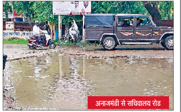
अनाजमंडी से सचिवालय रोड