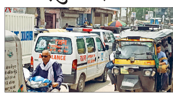
रेवाड़ी। सरकुलर रोड पर जाम में फंसी एंबुलेंस तथा सरकुलर रोड पर जाम खुलवाती महिला पुलिसकर्मी।

सरकुलर रोड से हॉर्ट के मरीज को लेकर जा रही एंबुलेंस सरकुलर रोड पर ट्रामा सेंटर से जैन स्कूल के बीच लगे जाम में फंस गई। सूचना के बाद पहुंची पुलिस ने जाम खुलवा कर एंबुलेंस को आगे के लिए रवाना किया। इसी दौरान एक दूसरी एंबुलेंस भी जाम फंस गई, जिसमें भी एक मरीज था। सरकुलर रोड पर अतिक्रमण व अवैध पार्किंग के कारण जाम लगा आम बात हो गई है। प्रशासन की ओर से इस दिशा में कोई ठोस कदम नहीं उठाए जा रहे हैं। सरकुलर रोड पर स्थित बैंक, अस्पतालों, स्कूल व निजी प्रतिष्ठानों के पास अपनी पार्किंग नहीं है, जिससे न्हीकल सड़क पर खड़े रहते हैं और जाम की स्थिति पैदा हो जाती है। सोमवार को एक एंबुलेंस गांव कुंड के हार्ट पेशेंट को लेकर